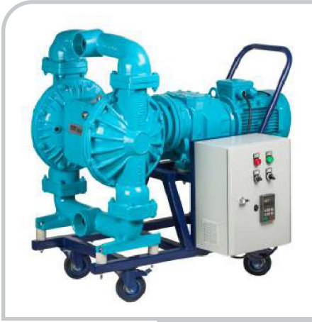
DP - 30E

Elektrikli Diyaframlı Pompalar / DP-30E Electromechanical Diaphragm Pumps / DP-30E