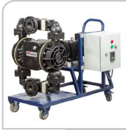
DP - 30E